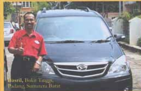
Basril, Bukit Tinggi, Padang, Sumatera Barat