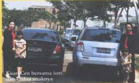
Kuan Gen bersama istri dan kedua anaknya

Salam dahsyat! Kesuksesan menunggu untuk menghampiri kita untuk diperjuangkan. Perjuangan hidup adalah janji yang harus dipegang teguh untuk mencapai cita-cita.